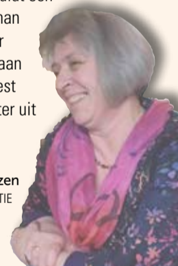
• Marieke (A.M.) van der Giessen-van Velzen HOOFD/EINDREDACTIE

'Waar het hart vol van is, loopt de mond van over', luidt een spreekwoord. Maar de boodschap van heil aan de man en vrouw brengen is niet iets waar ik van uur tot uur voor klaar sta. Er moet ook gewoon gewerkt en gedaan worden. Gelukkig lees ik in de Bijbel dat het 'de Geest zelf is die ons beweegt' en 'stromen van levend water uit ons binnenste laat vloeien'. Dat scheidt ruimte.