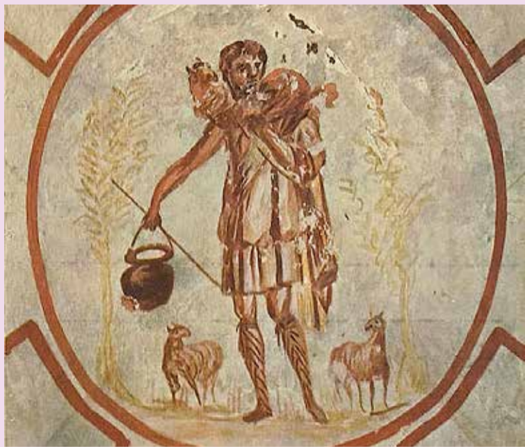
Fresco 'Goede Herder', circa 280 na Christus, Catacomben van Priscilla, Rome