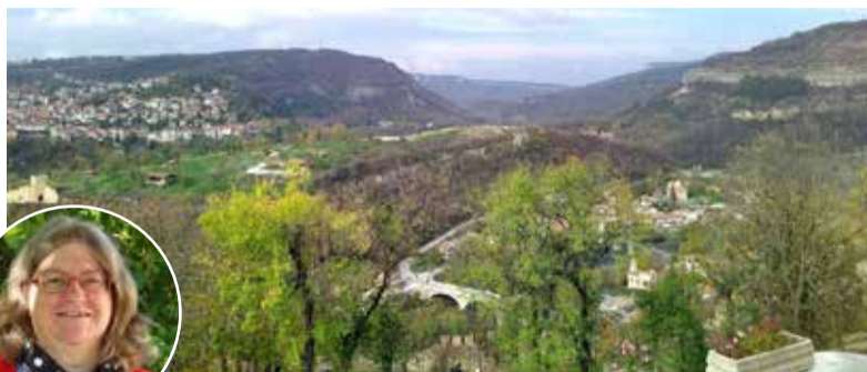
Uitzicht vanaf de Tsarevets-burcht in Veliko Tarnovo