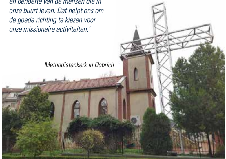
Methodistenkerk in Dobrich